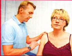
Die Untersuchung der Schulter ergab: Eine Verengung ist schuld