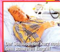
Der Schauspieler kurz nach dem schweren Eingriff