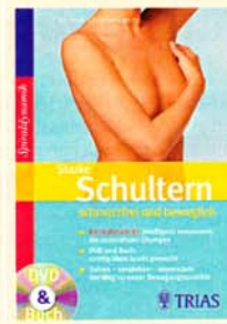
Sehen und lesen: die neue Art der Selbsthilfe