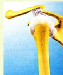
Unter dem Schulterdach müssen sich Sehnen und Bänder den Platz teilen

Mangeldurchblutung oft Kalkdepots. Ursache ist eine Veränderungen im Stoffwechsel. Es lagern sich Kalksalze an, die sich zu kleinen Körnern zusammenballen. Sie können so winzig wie ein Stecknadelkopf sein, aber auch so groß wie eine Kastanie. Auf jeden Fall schmerzen sie bei jeder größeren Bewegung der Oberarme.