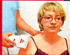
Durch die Laserdusche schwillt die Entzündung ab