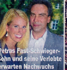
Petras Fast-Schwiegersohn und seine Verlobte erwarten Nachwuchs

Bringt ein Baby endlich wieder Licht in ihr tristes Dasein? Seite 68/69